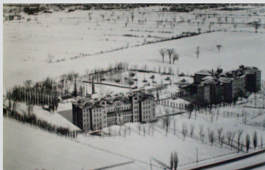
L'orphelinat Notre-Dame-de-Liesse et la Crèche D'Youville dans un environnement agricole, sans date

La valeur historique du 5935, chemin de la Côte-de-Liesse repose sur :