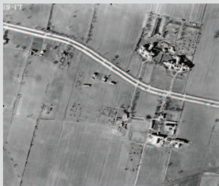
Le chemin de la Côte-de-Liesse, l'orphelinat, la crèche et les bâtiments de la ferme Saint-Charles, 1947