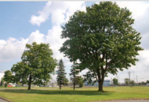
Les pelouses et les arbres du site

La valeur urbaine du 5935, chemin de la Côte-de-Liesse repose sur :