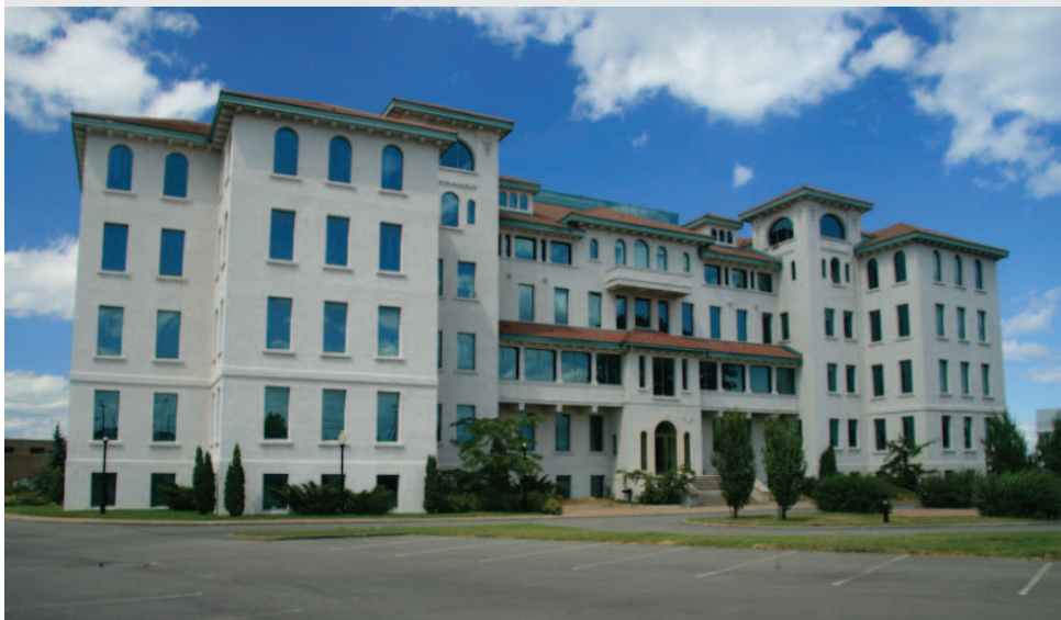
5935, chemin de la Côte-de-Liesse