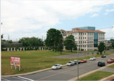
Le bâtiment depuis le chemin de la Côte-de-Liesse