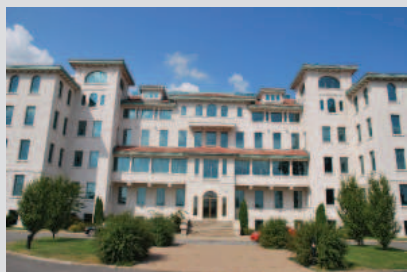
Façade principale

La valeur symbolique du 5935, chemin de la Côte-de-Liesse repose sur :