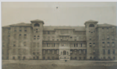
Façade principale, sans date

La valeur d'usage du 5935, chemin de la Côte-de-Liesse repose sur :